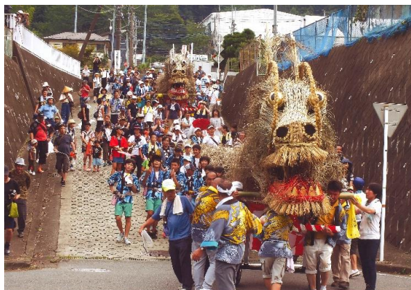
■ 清川村写真コンテスト作品

引き続き「ふるさと納税」制度の健全な運用に努めてまいりますので、今後とも神奈川県唯一の村『清川村』を応援していただきますようお願い申し上げます。