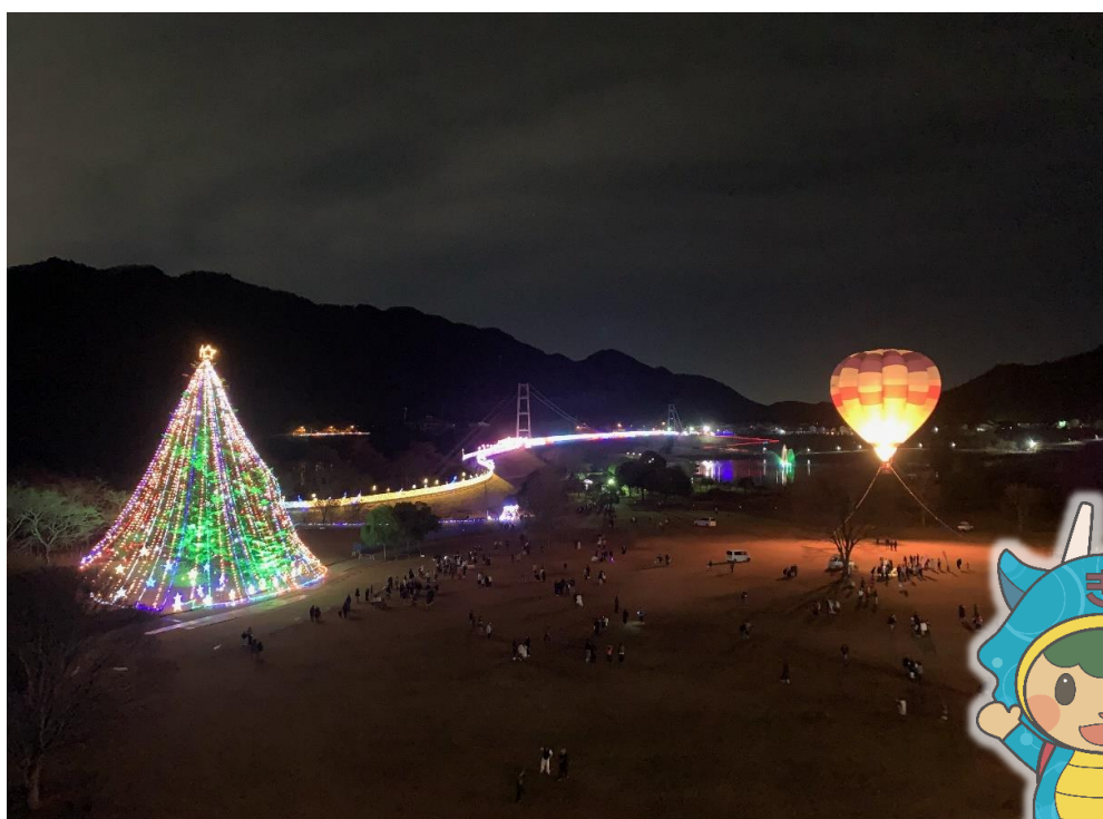
■宮ヶ瀬クリスマスみんなのつどい ジャンボツリーと気球