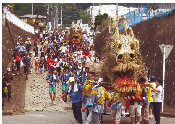
■ 清川村写真コンテスト作品

引き続き「ふるさと納税」制度の健全な運用に努めてまいりますので、今後とも神奈川県唯一の村『清川村』を応援していただきますようお願い申し上げます。