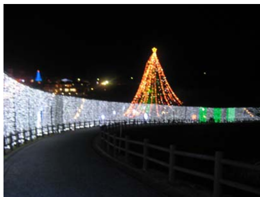
スターロードとジャンボクリスマスツリー