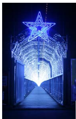
水の郷大つり橋 「光の回廊」の入口