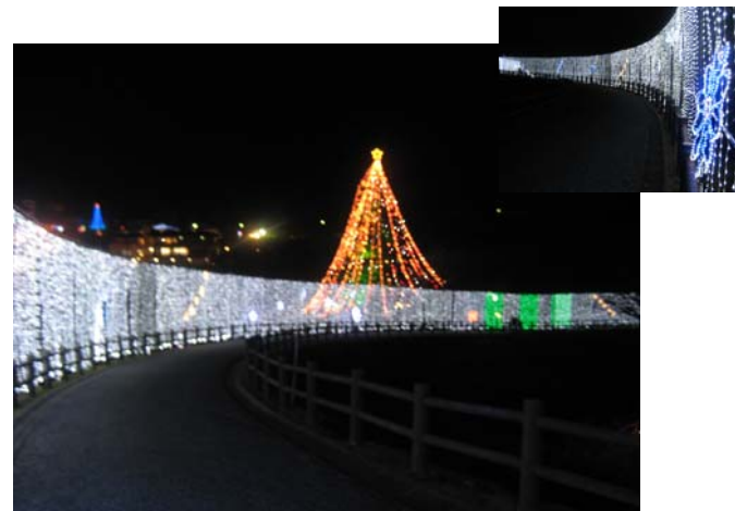
スターロードとジャンボクリスマスツリー