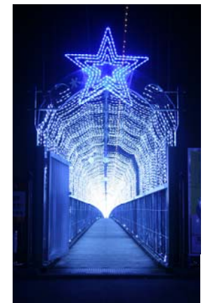
水の郷大つり橋 “光の回廊”の入口