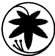
村の木 いろはもみじ