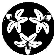
村の花 みつばつつじ