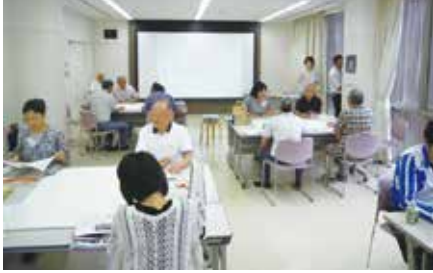
前回の村づくりワークショップの様子 (平成24年7月)