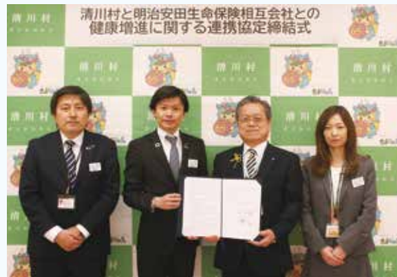
連携協定締結式の様子