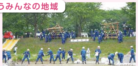
平成26年度の水防演習の様子