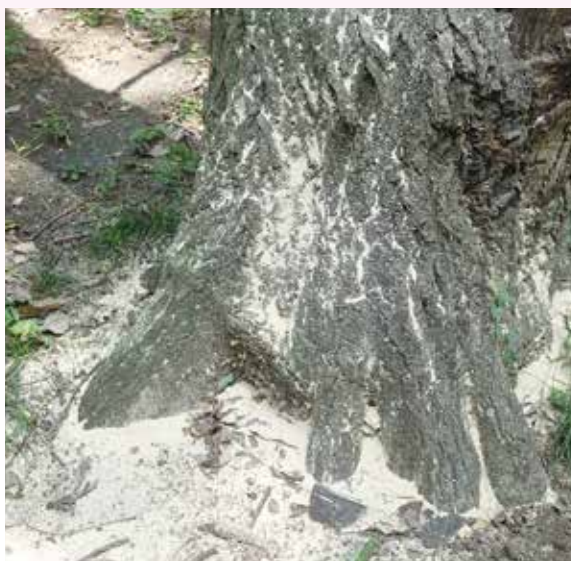
フラスの発生状況