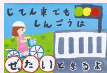
令和3年度交通安全ポスターコンクール入選作品 清水 明奈さんの作品(緑小)