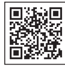
国税庁ホームページ

年末調整に係る情報提供体制は動画配信に変更されています。国税庁ホームページに「年末調整がよくわかるページ」が作成されていますので、ご覧ください。 なお、各種様式などは国税庁ホームページから印刷ができるほか、役場庁舎1階・税務住民課窓口でも配布しています。