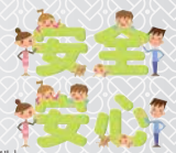
マイクローベルト