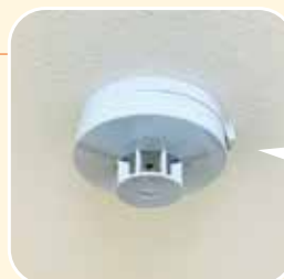
住宅用 火災警報器