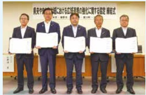
協定締結式の様子

この度、丹沢・大山を軸とした地理的・歴史的なつながりのある「県央やまなみ地域」の連携をより緊密なものとし、より質の高い行政サービスの提供や広域観光圏の確立といった地域全体の活性化と、将来にわたって発展し続ける地域社会の創造のため「県央やまなみ地域における広域連携の強化に関する協定」を締結しました。