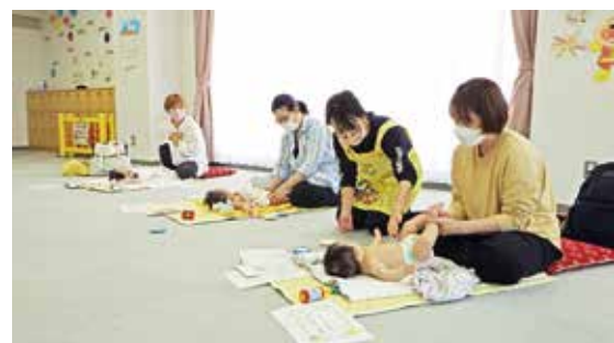
ベビーマッサージのようす