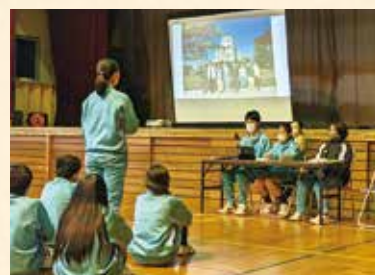
10月 恒久平和推進事業実施