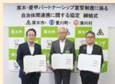
7月 パートナーシップ宣誓制度に係る自治体間連携に関する協定を締結