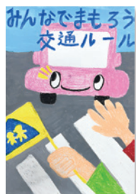
いし みなと 石井湊大(緑小2年)