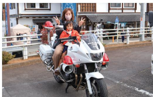
アトラクションの様子①

物品の配布、清川村防犯協会と防犯パトロールブルーラインによる「青色防犯パトロール車の展示」、民間自動車販売会社による、3Dアラウンドビューモニターをはじめとした、運転支援システム搭載車の乗車体験、清川村交通安全対策協議会による交通安全スタンブラリー抽選会が行われ、会場は多くの方で盛り上がりしました。