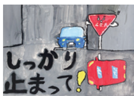
かわはら くるみ 河原来桃(緑小5年)