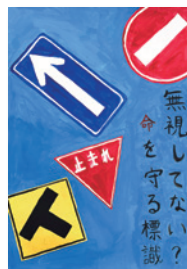
おちあいな つき 落合夏希(緑中1年)