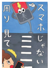
まえだ きき 前田希咲(緑小6年)