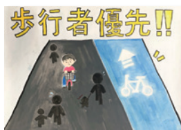
いとう ひな 伊藤日菜(緑中1年)