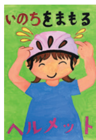
つかだ ひなた 塚田ひなた(緑小3年)