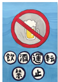
しみず あきな 清水明奈(緑小6年)