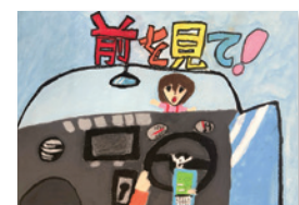
あさくら あずさ 朝倉梓(緑小4年)