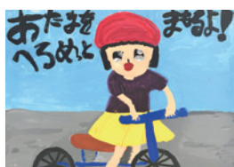
しもじま ほのか 下嶋穂香(緑小1年)