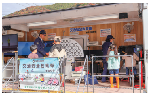
アトラクションの様子②