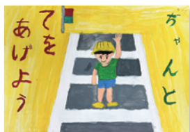
わたなべ れい 渡邊礼惟(緑小1年)