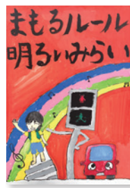
やまだ あやと 山田絢斗(緑小3年)