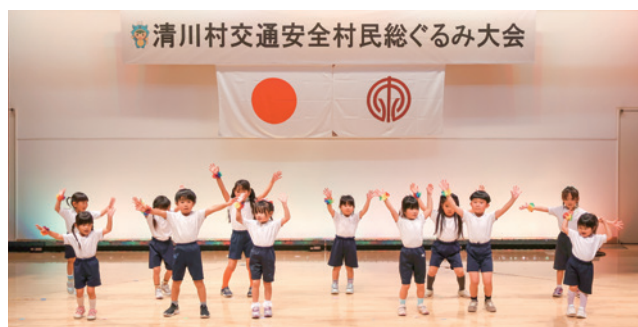
あおぞら保育園演技