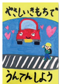
おや まお 大矢磨生(緑小2年)