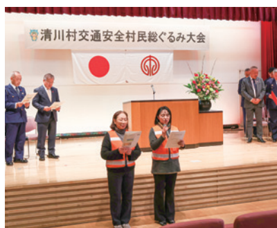
交通安全4つの誓い

また式典終了後は、同会場であおぞら保育園児による演技が披露され、役場第1駐車場では厚木警察署による「パトカー・白バイの展示」や横断歩道・自転車