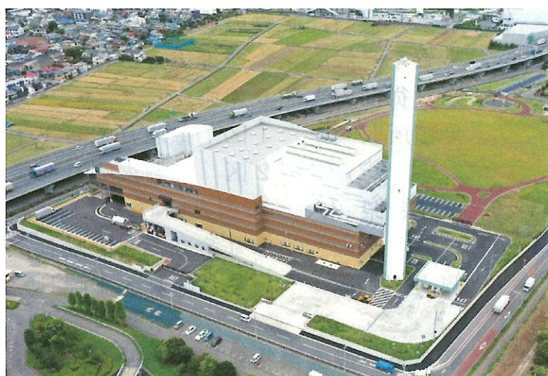
厚木愛甲環境施設組合