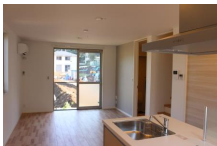
↑リビング(イメージ)